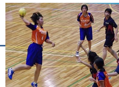
活発な部活動 (ハンドボール部)