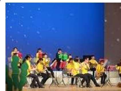
吹奏楽部定期演奏会