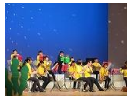
吹奏楽部定期演奏会