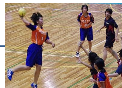
活発な部活動 (ハンドボール部)