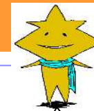
東高キャラクター 「Cochi」コチ