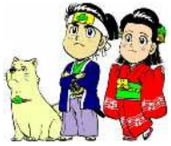
マツカ・松太郎・松姫