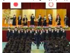
(入学式での吹奏楽部)