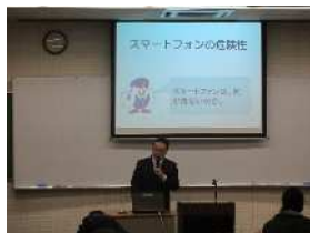
外部講師による授業

自ら考え、判断し、目標に向かい着実に努力するとともに 他者への思いやりの心を持った心豊かな生徒を育てる学校