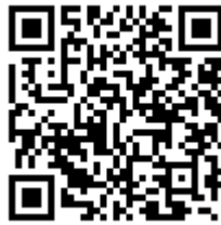
(鴻巣高校 Web ページ)