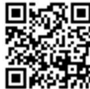
本校ホームページのQRコード