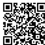
ホームページ QR コード