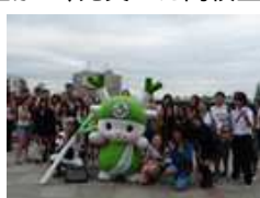
ホームステイによる国際交流