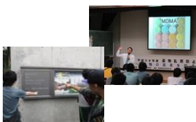
(進路見学会・講演会)

○「浦定プライド」を合言葉に生徒達は日々の学習・学校行事に主体的に取り組んでいます。