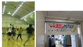
(球技大会・文化祭)

○「浦定プライド」を合言葉に生徒達は日々の学習・学校行事に主体的に取り組んでいます。