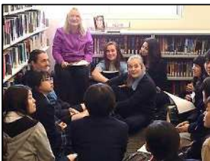
(オーストラリア研修)