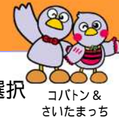
コバトン & さいたまっち