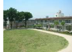
(運動会) (文化祭・ゆりの木祭)(高等部校内実習) (高等部作業学習) (本校グラウンド)