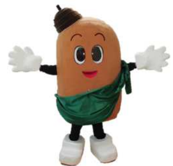
上尾かしの木特別支援学校の キャラクター「かっしー！！」