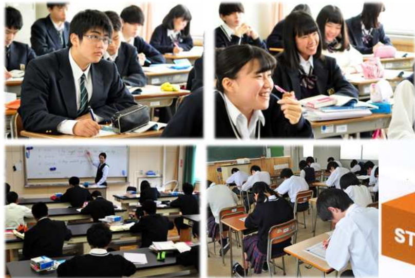
1年英語の学力別少人数授業