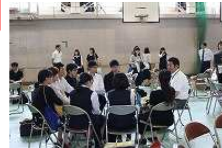
〔3年生の進路フェスタにて〕

3年次はさまざまな進路を目指す生徒の希望に応えられるよう、多彩な選択科目を開講しています。